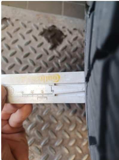
1.2 Øvrig opplysninger