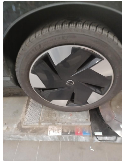
1.2 Øvrig opplysninger