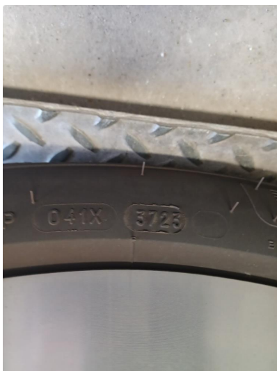
1.2 Øvrig opplysninger