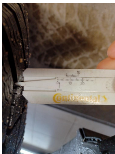
1.2 Øvrig opplysninger