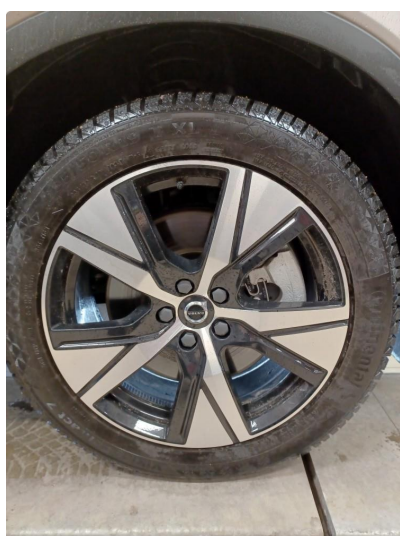
1.2 Øvrig opplysninger