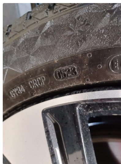
1.2 Øvrig opplysninger