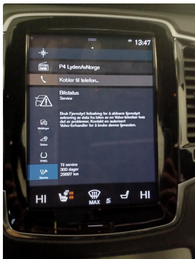
1.1 Dokumentert service, se bilde