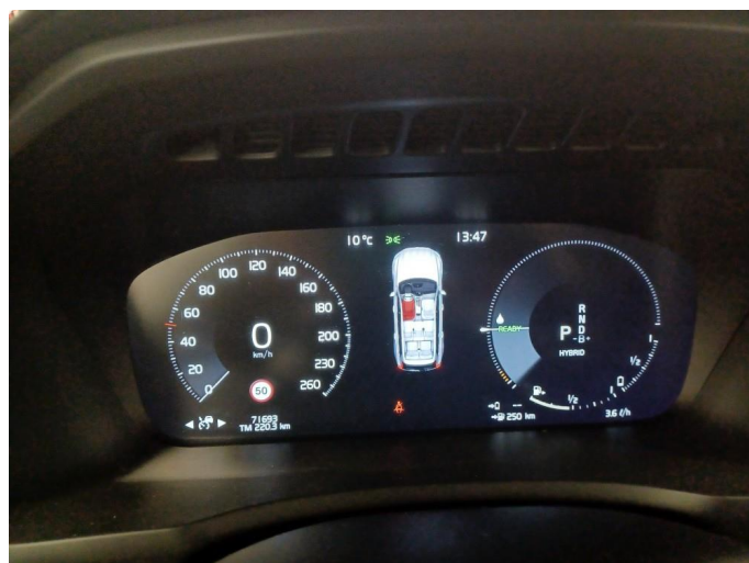
1.2 Øvrig opplysninger