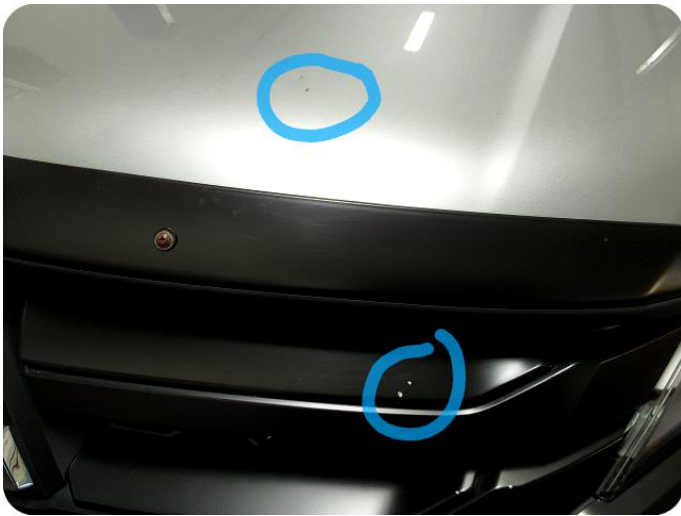
1.1 Steinsprut Steinsprutpanser og grillen