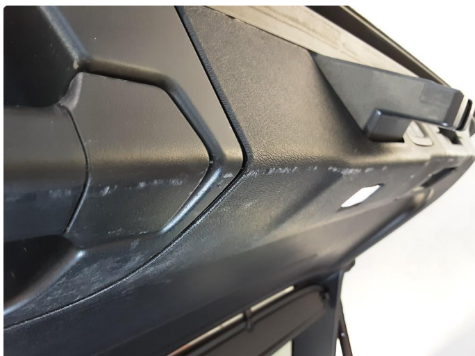
1.1 Bakluketrekk ripe(r)