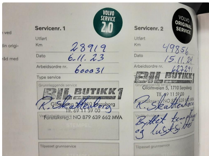
1.1 Dokumentert service, se bilde