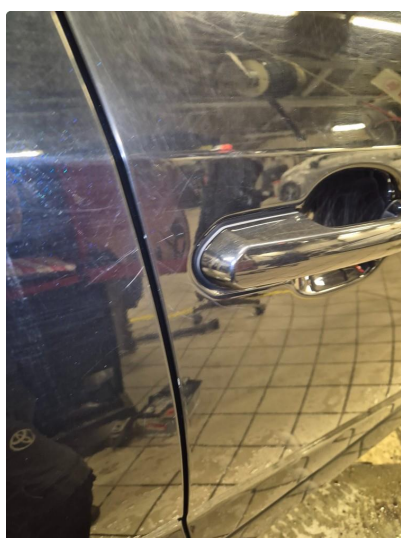
2.1 Noen steinsprang og riper i lakk