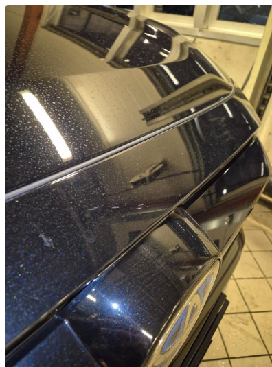
2.1 Noen steinsprang og riper i lakk