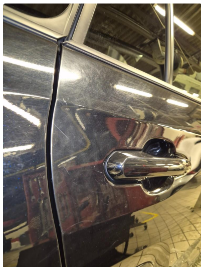
2.1 Noen steinsprang og riper i lakk