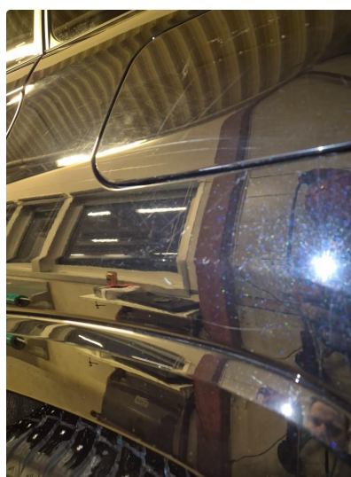
2.1 Noen steinsprang og riper i lakk