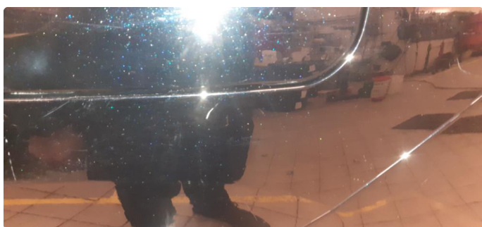
1.3 Noen steinsprang og riper i lakk