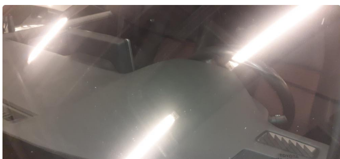
1.2 Steinsprut på frontrute