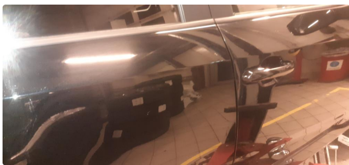
1.3 Noen steinsprang og riper i lakk