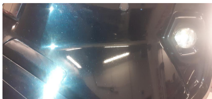
1.3 Noen steinsprang og riper i lakk