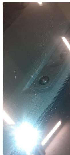
1.2 Steinsprut på frontrute