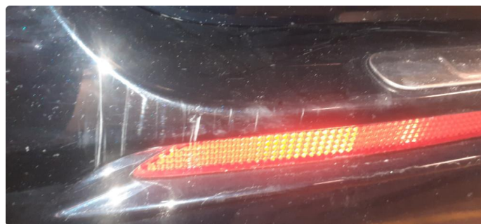
1.1 Ripe(r) ned til grunning, reparert