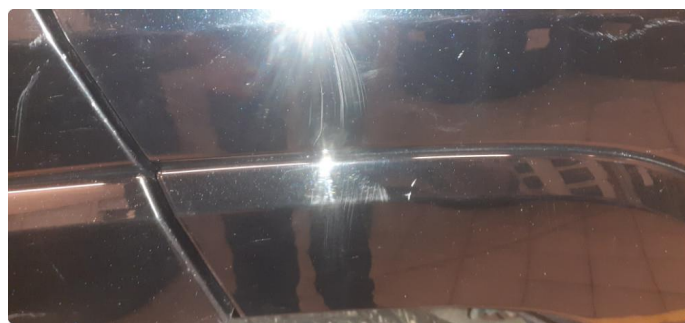
1.3 Noen steinsprang og riper i lakk