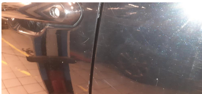
1.3 Noen steinsprang og riper i lakk