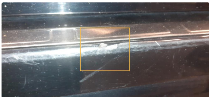
1.1 Ripe(r) ned til grunning, reparert