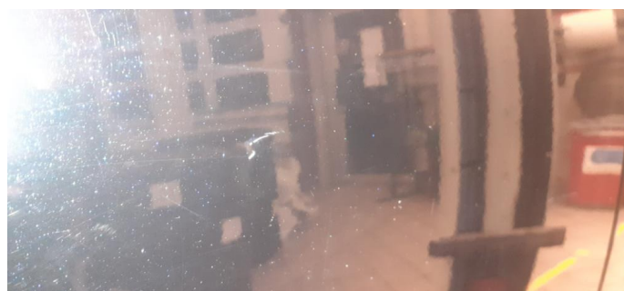
1.3 Noen steinsprang og riper i lakk