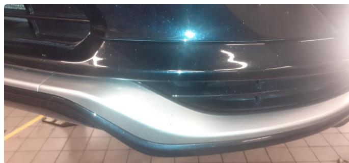
1.3 Noen steinsprang og riper i lakk