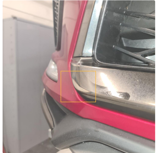
1.2 Øvrige feil, fixet