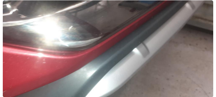
1.2 Øvrige feil, fixet