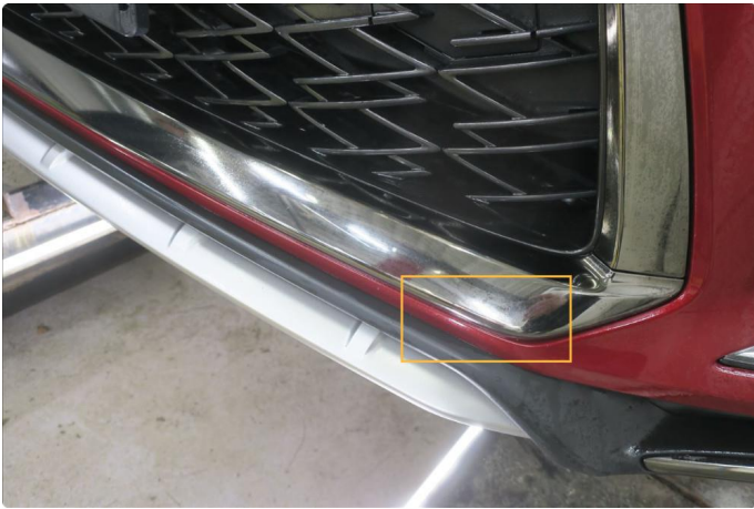
1.2 Øvrige feil, fixet