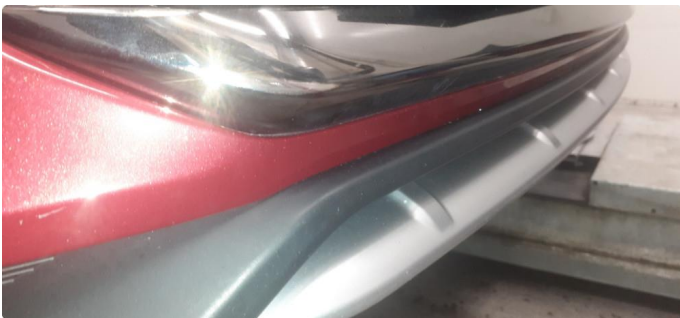
1.2 Øvrige feil, fixet