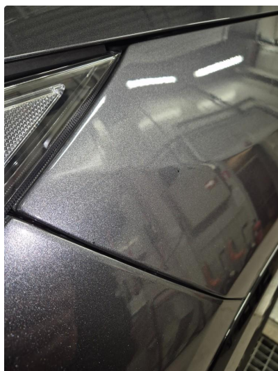
2.2 Noen steinsprang og riper i lakk