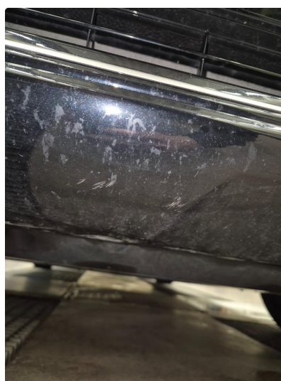
2.2 Noen steinsprang og riper i lakk