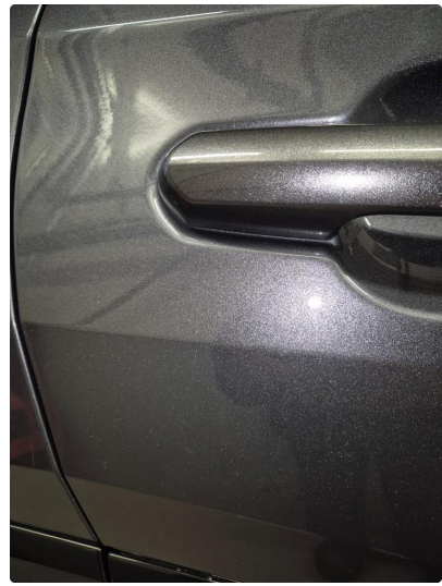
2.2 Noen steinsprang og riper i lakk