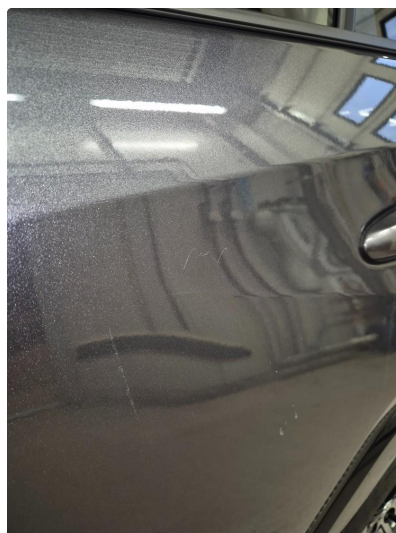
2.2 Noen steinsprang og riper i lakk