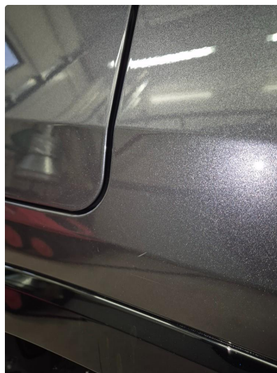
2.2 Noen steinsprang og riper i lakk