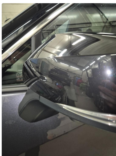
2.2 Noen steinsprang og riper i lakk