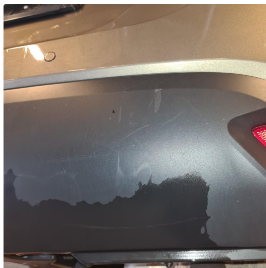
1.1 Noen riper og steinsprang i lakk.