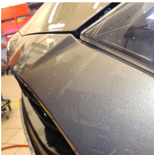
1.1 Noen riper og steinsprang i lakk.