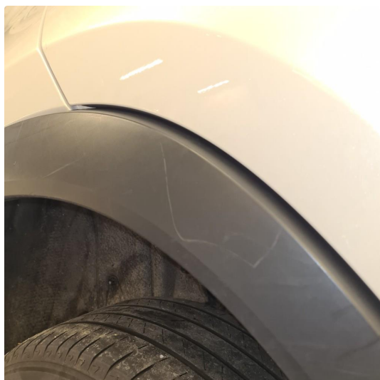
2.1 Noen steinsprang og riper i lakk.