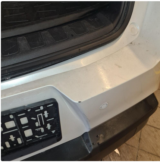
2.2 Noen hakk/riper