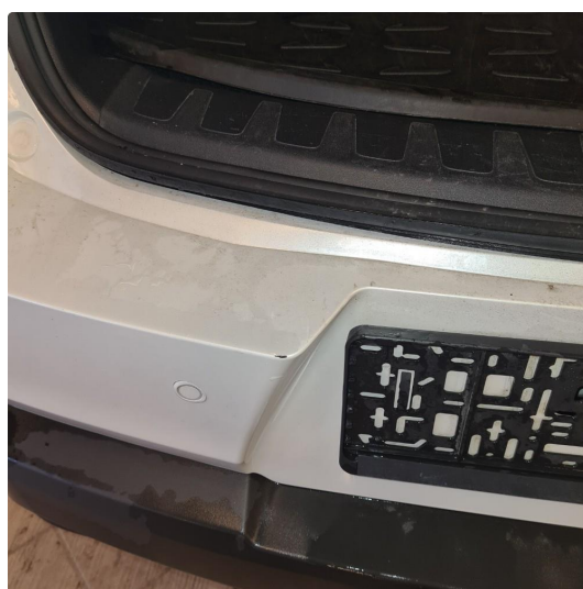
2.2 Noen hakk/riper