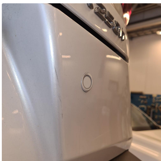
2.1 Noen steinsprang og riper i lakk.