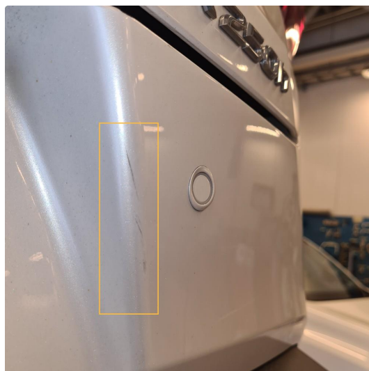
2.1 Noen steinsprang og riper i lakk.