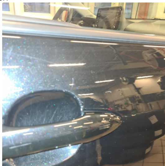
1.1 Noe steinsprang, riper i lakk samt noen p-bulker.