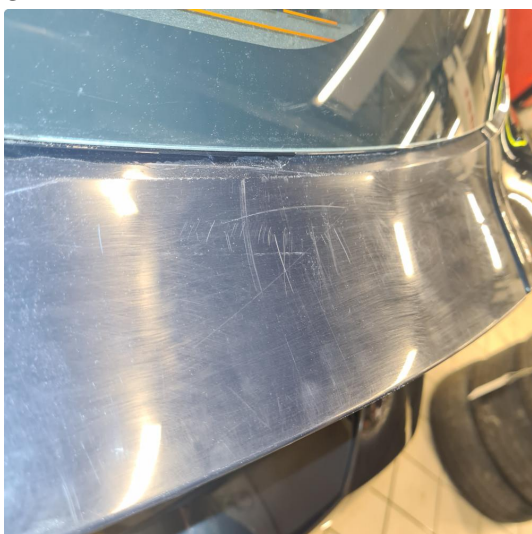
1.1 Noe steinsprang, riper i lakk samt noen p-bulker.