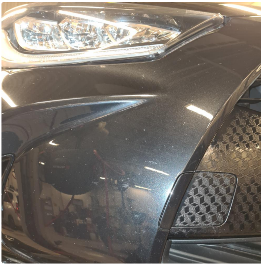
1.1 Noe steinsprang, riper i lakk samt noen p-bulker.