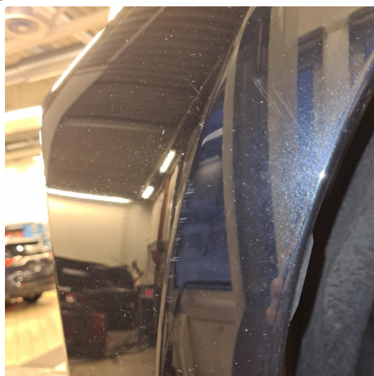
1.1 Noe steinsprang, riper i lakk samt noen p-bulker.