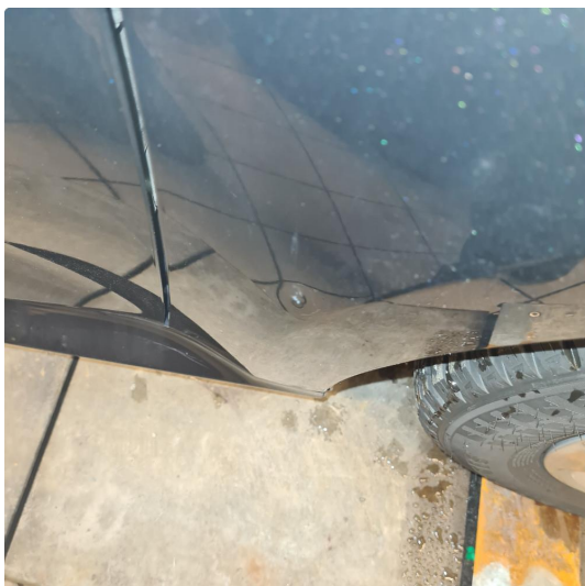
1.1 Noe steinsprang, riper i lakk samt noen p-bulker.