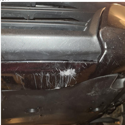
1.1 Noe steinsprang, riper i lakk samt noen p-bulker.