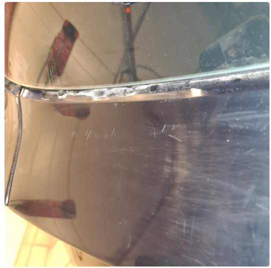
1.1 Noe steinsprang, riper i lakk samt noen p-bulker.