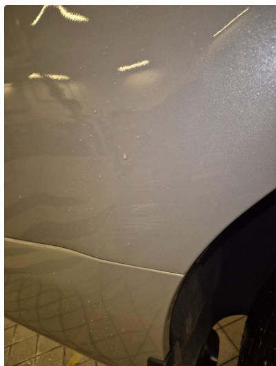
1.2 Noen steinsprang og riper i lakk