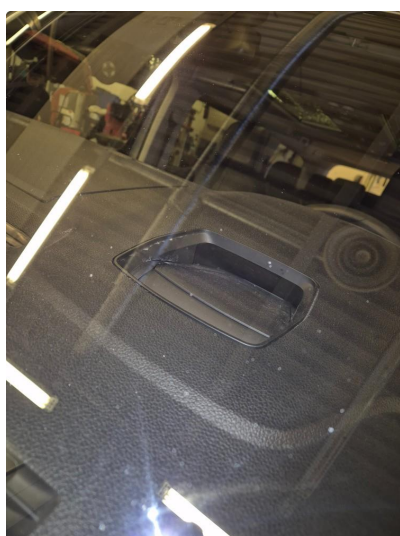
1.2 Noen steinsprang og riper i lakk