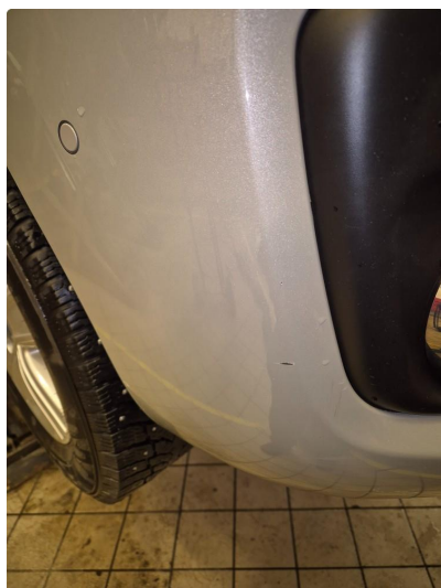
1.2 Noen steinsprang og riper i lakk