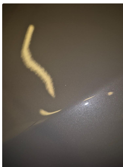
1.2 Noen steinsprang og riper i lakk