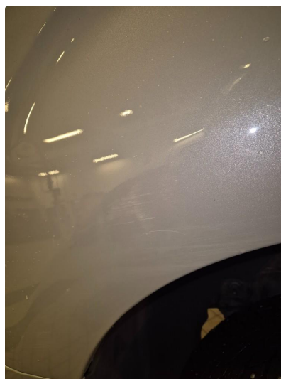
1.2 Noen steinsprang og riper i lakk