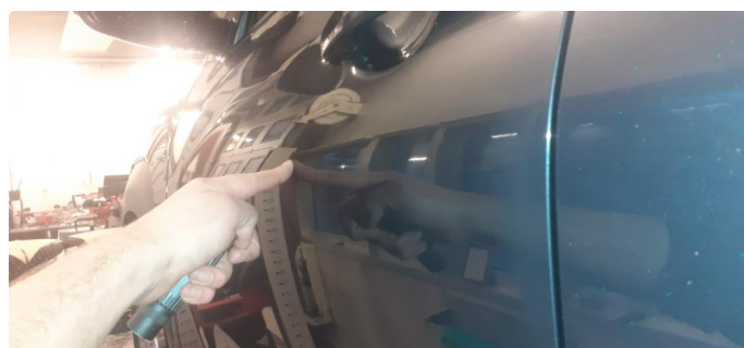
1.2 Noen steinsprang og riper på bil og p-bulk