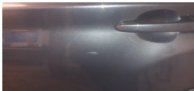
1.2 Noen steinsprang og riper på bil og p-bulk