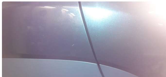
1.2 Noen steinsprang og riper på bil og p-bulk