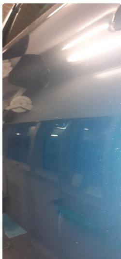
1.2 Noen steinsprang og riper på bil og p-bulk