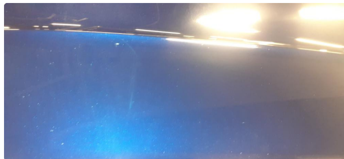
1.1 Noen steinsprang og riper i lakk