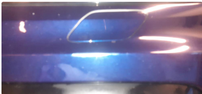
1.1 Noen steinsprang og riper i lakk