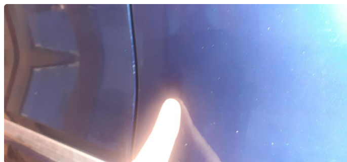
1.1 Noen steinsprang og riper i lakk