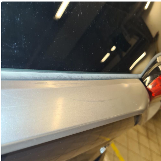
1.2 Noen steinsprang og riper i lakk