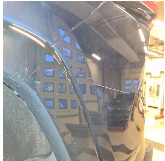
1.2 Noen steinsprang og riper i lakk