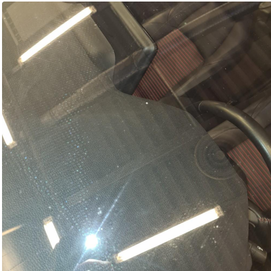
1.1 Noen steinsprang i fronrute