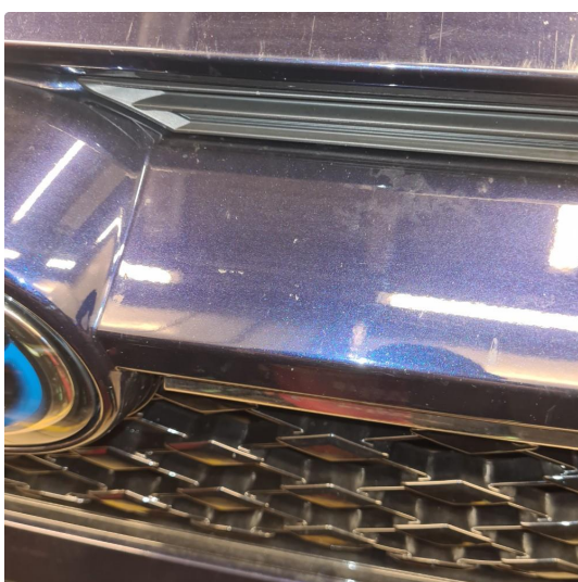
1.2 Noen steinsprang og riper i lakk