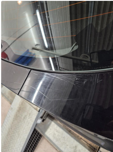
1.1 Noen steinsprang og riper i lakk