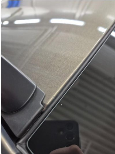
1.1 Noen steinsprang og riper i lakk