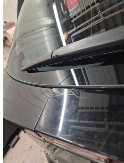
1.1 Noen steinsprang og riper i lakk