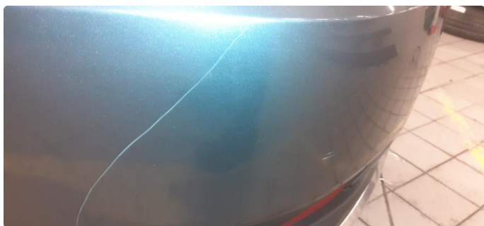
1.3 Noen steinsprang og riper i lakk