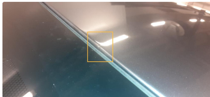
1.1 Steinsprut med rust