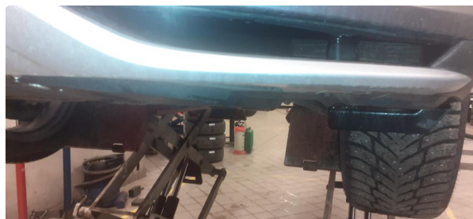
1.2 Noen stensprang og riper i lakk