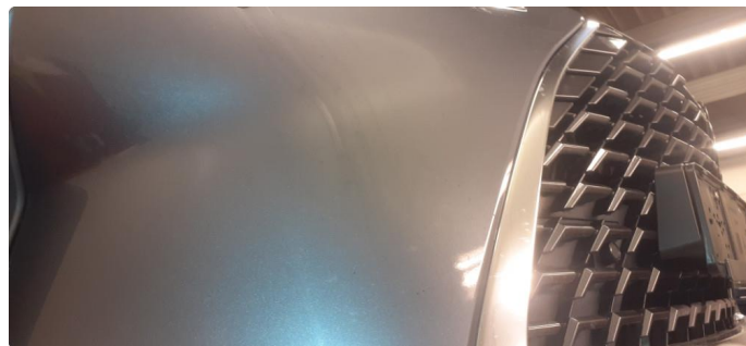
1.2 Noen stensprang og riper i lakk