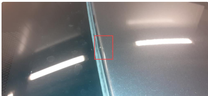
1.1 Steinsprut med rust