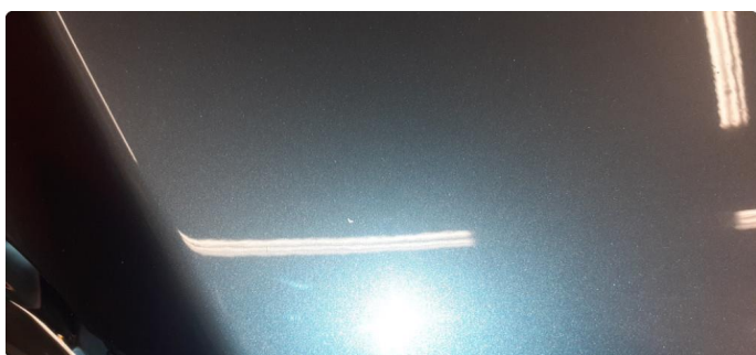
1.2 Noen stensprang og riper i lakk