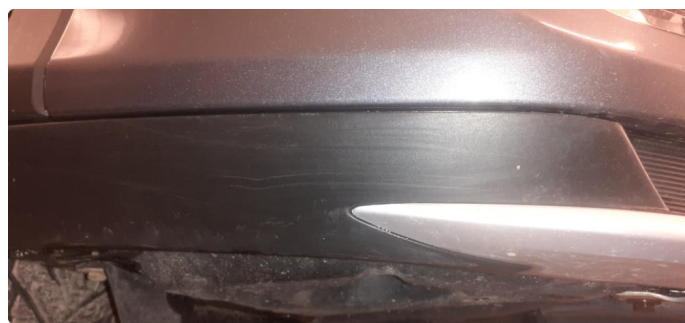
1.2 Noen stensprang og riper i lakk