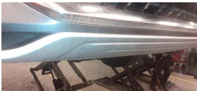
1.2 Noen stensprang og riper i lakk