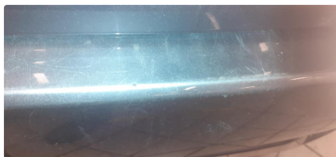
1.3 Noen steinsprang og riper i lakk