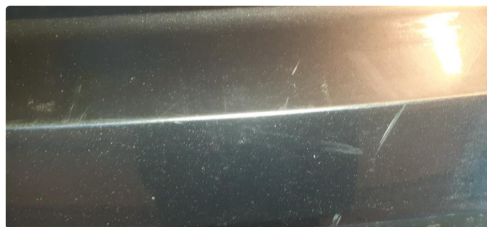
1.3 Noen steinsprang og riper i lakk