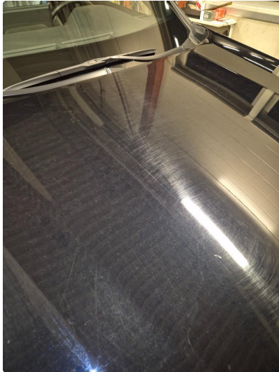
1.1 Noen steinsprang og riper i lakk.