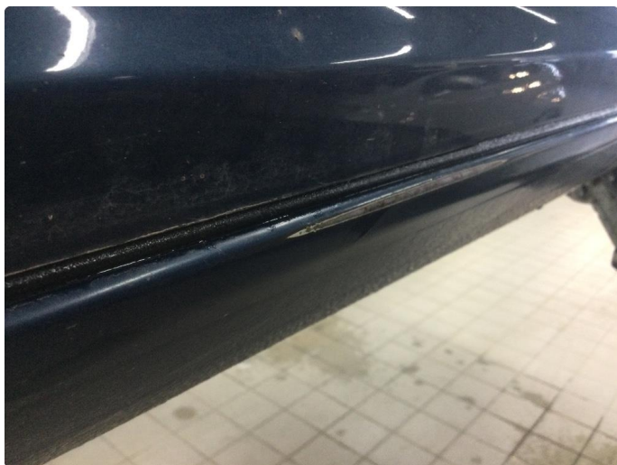
1.5 Ripe(r) ned til grunning