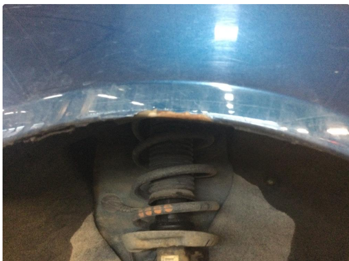
1.1 Lakk flasser