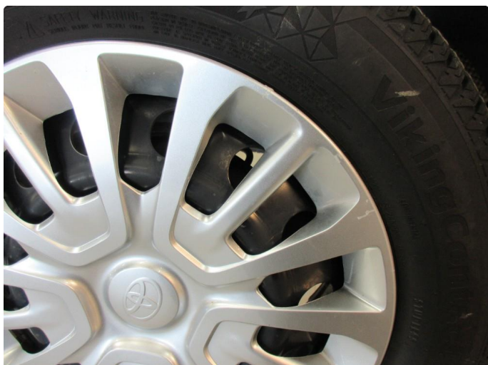
1.1 Hjulksel skadet