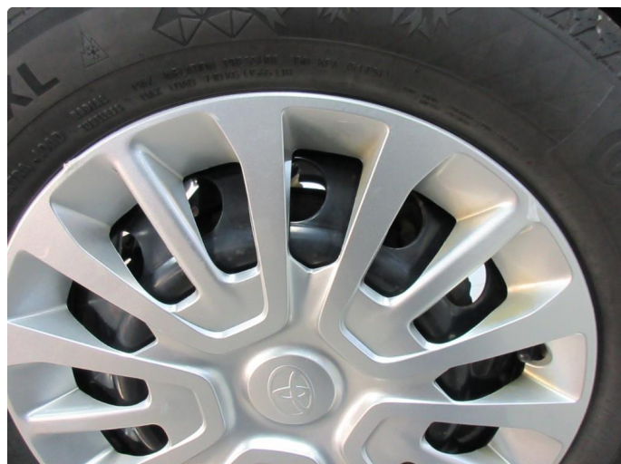
1.1 Hjulksel skadet