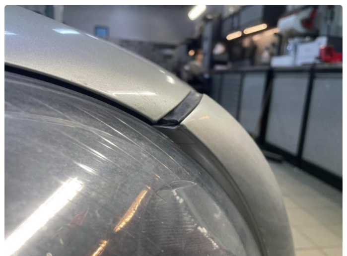
1.5 Øvrige feil