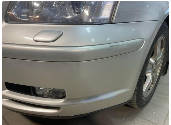
1.3 Lakk flasser