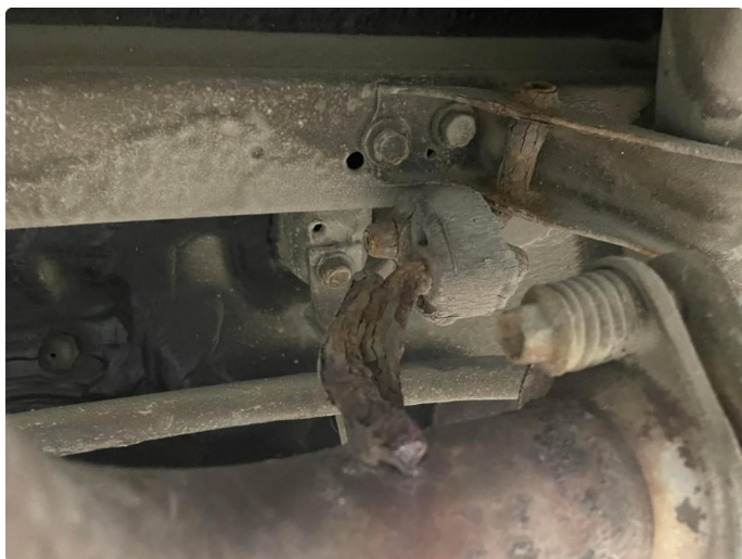
2.1 Feste ved bakre skjøte rust