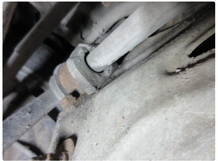
3.3 Slitt stabstagforing