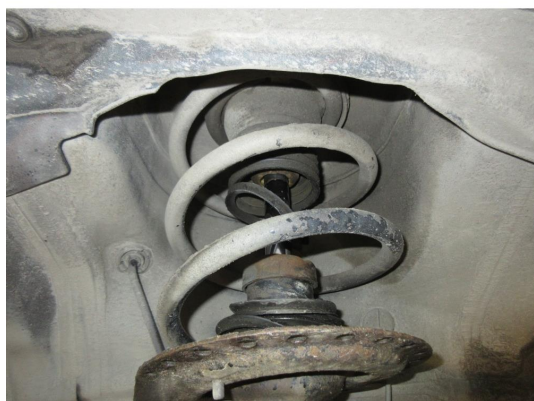
3.1 Støvmansjett defekt