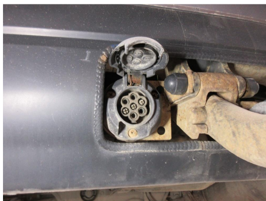
1.1 Lokk har mistet spenn og tegn til irr i kontakt