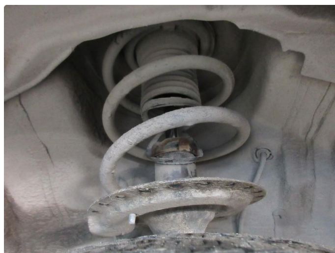
3.2 Støvmansjett defekt