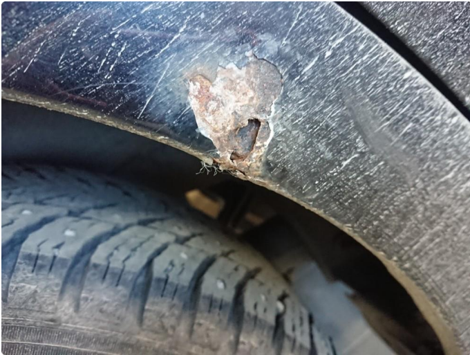
1.1 Rustdannelse i forbindelse med en karosserijobb fra 2016