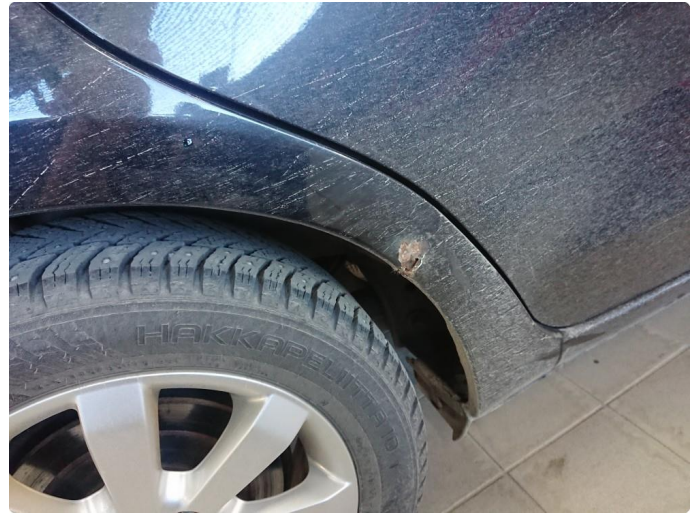
1.1 Rustdannelse i forbindelse med en karosserijobb fra 2016