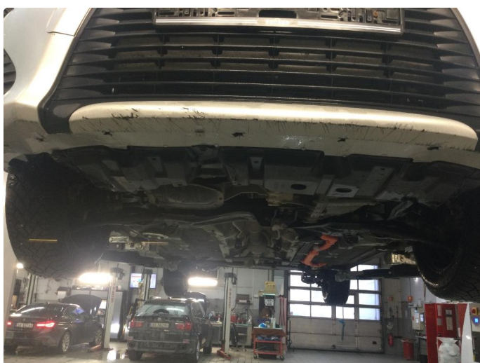
1.4 Spoilerlist mangler