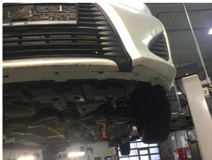
1.3 Skrubbskader underkant