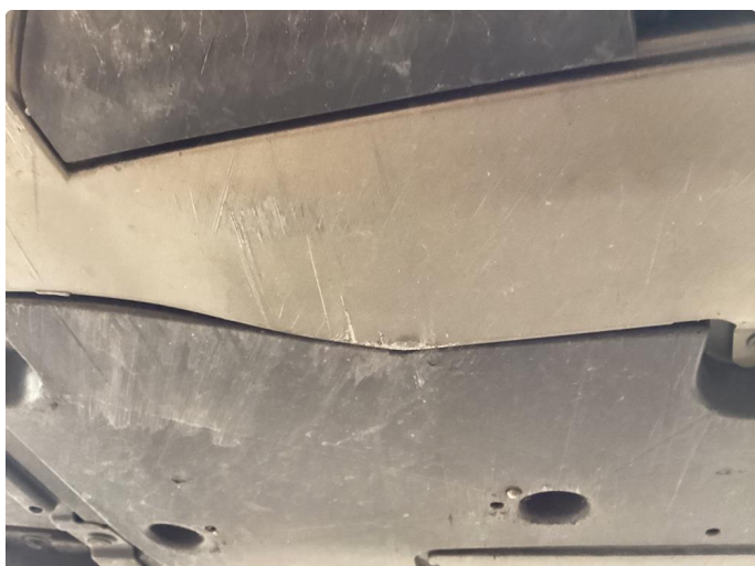
1.2 Skrubbskader underkant