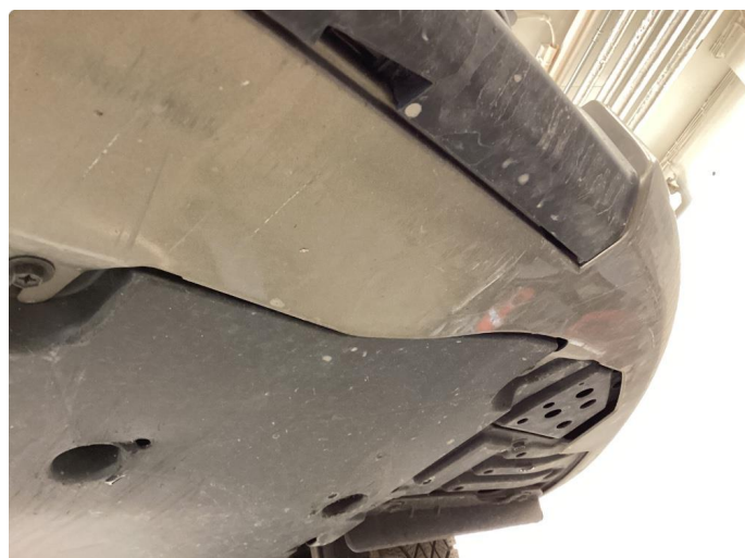
1.2 Skrubbskader underkant