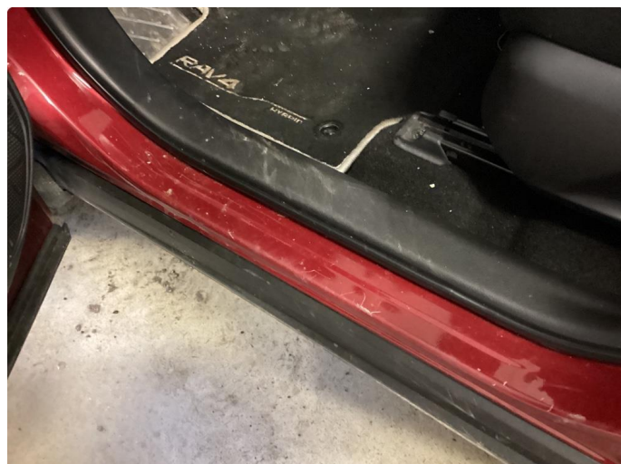
1.1 Skadet list