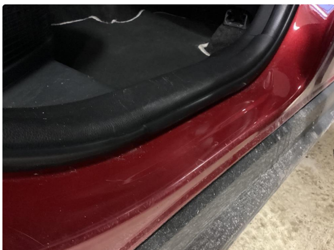
1.1 Skadet list