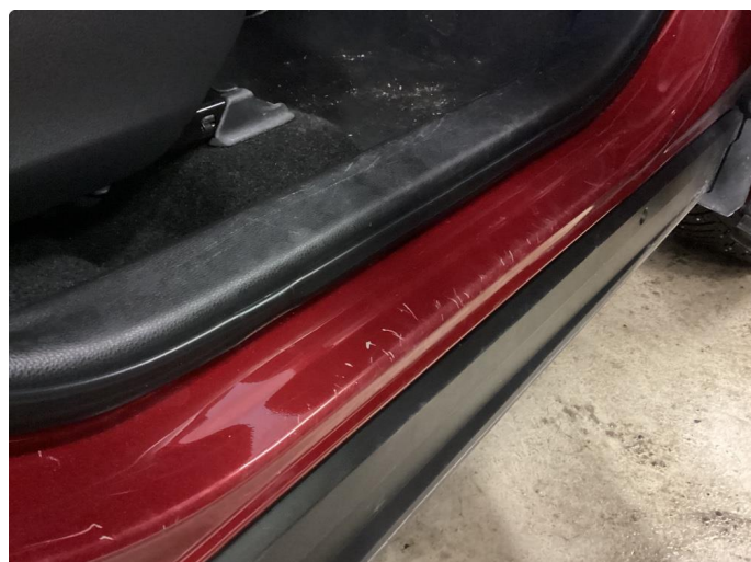
1.1 Skadet list