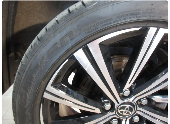
1.1 Skade på felg