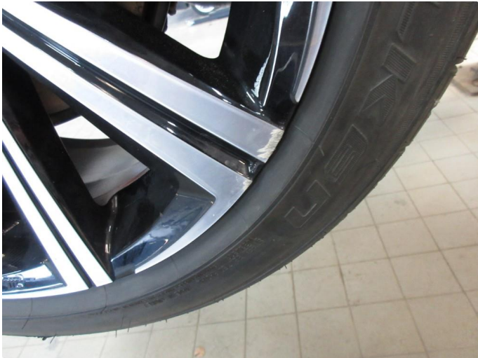
1.1 Skade på felg