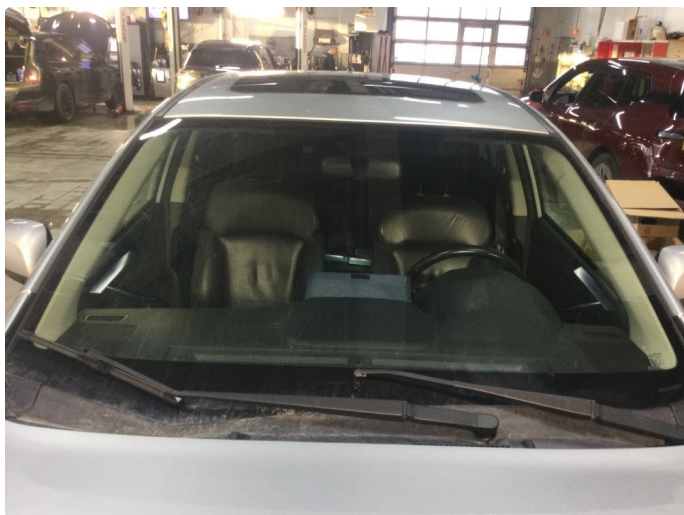
1.5 Noen små steinsprut her og der på frontrute.