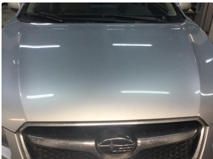
1.1 Noen små steinsprut på panseret.