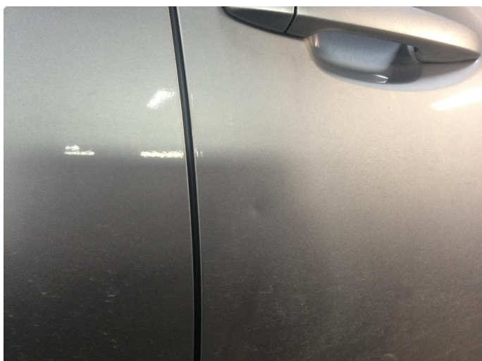
1.2 Liten bulk på høyre passasjer dør foran