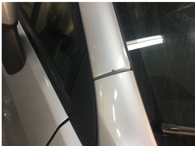
1.6 Noen steinsprut på høyre a-stolpe