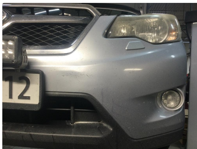
1.4 Noen steinsprut på støtfanger foran