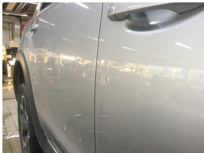
1.2 Liten bulk på høyre passasjer dør foran