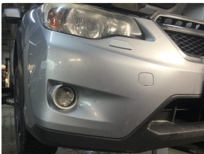
1.4 Noen steinsprut på støtfanger foran