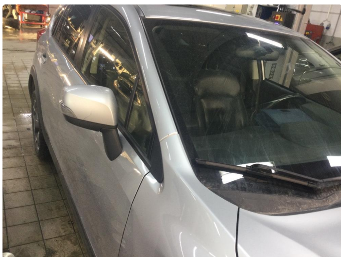
1.6 Noen steinsprut på høyre a-stolpe