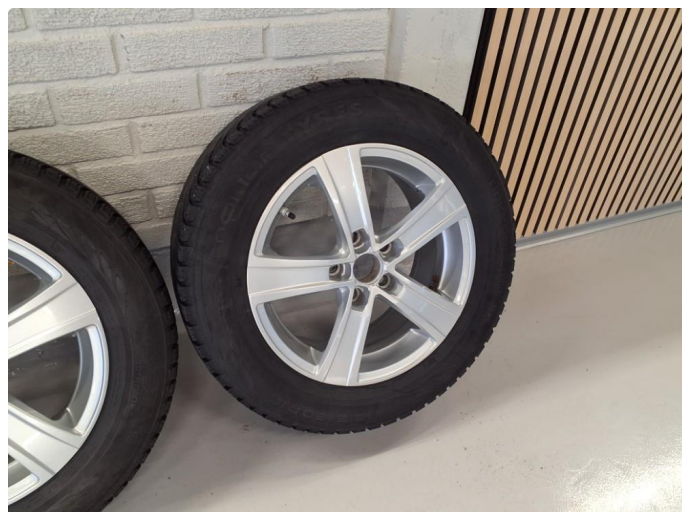
1.2 Navkopp mangler