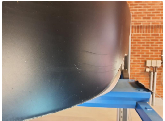
1.1 Noe riper