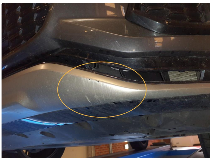
1.2 Noe skrubbskader underkant