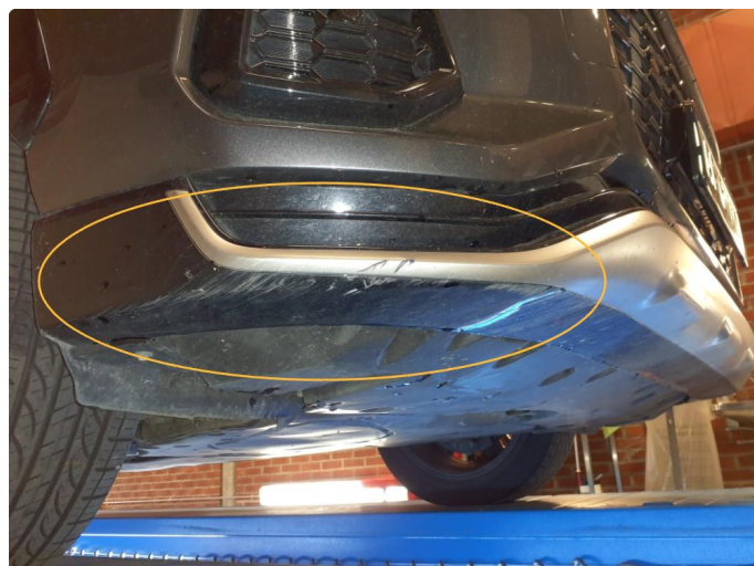
1.2 Noe skrubbskader underkant