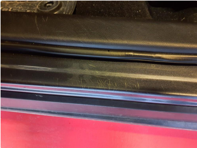
1.1 Noen småriper