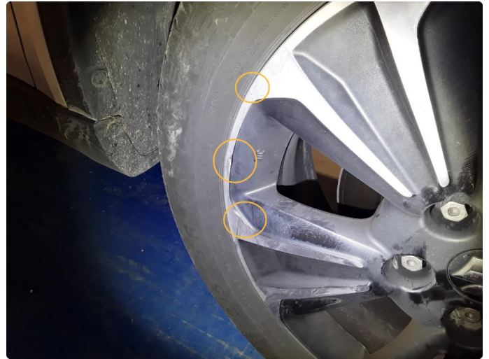
1.2 Riper felg.