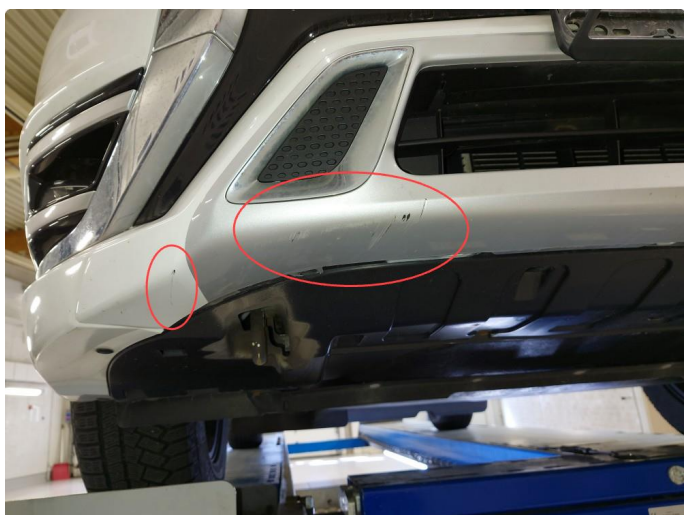
1.3 Skrubbskader underkant