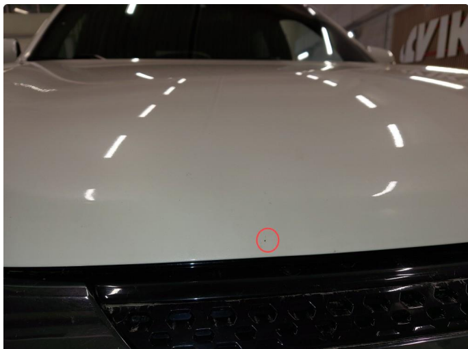
1.1 Noe steinsprut