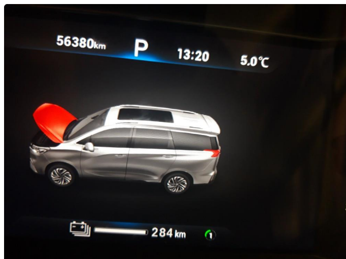
2.1 Dokumentert service, se bilde