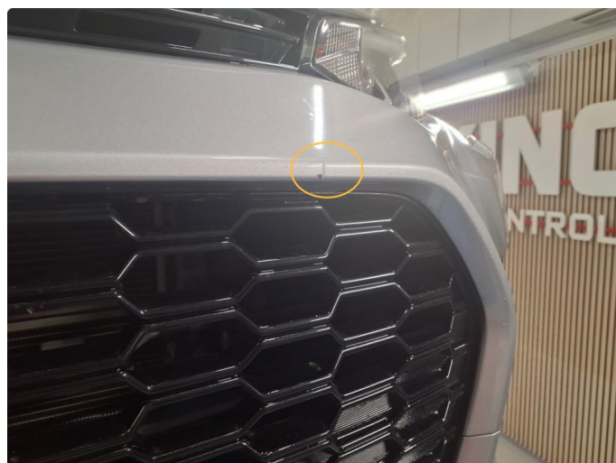
1.4 Liten merke på støtfanger foran.