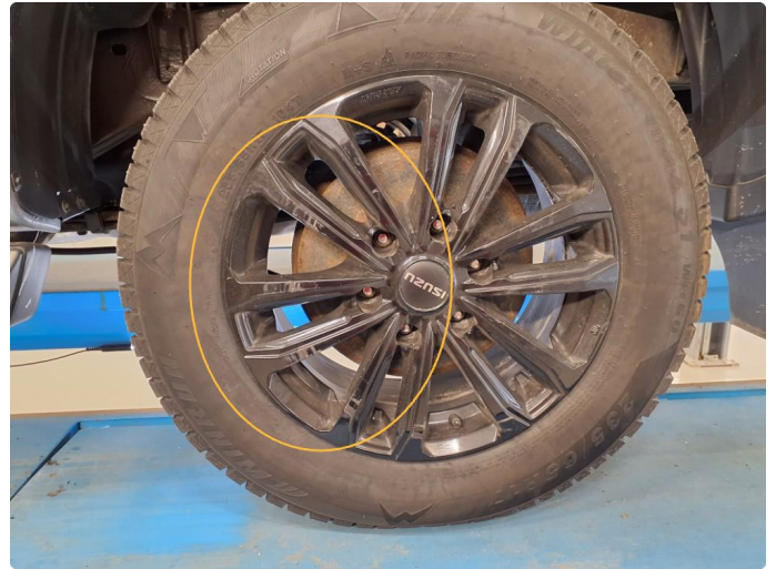
1.2 Kantkjørt vinterfelg felg