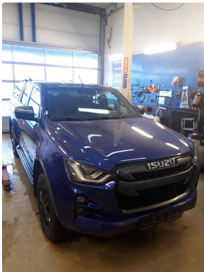
1.1 Noe steinsprut