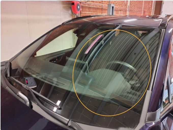
1.1 Steinsprut Reparert.