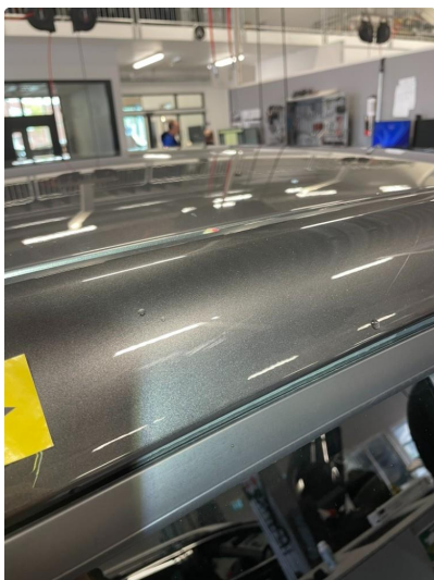
1.1 Generelt mye riper