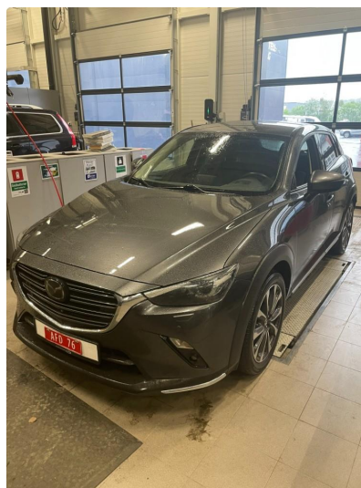
1.2 Gamle dekk