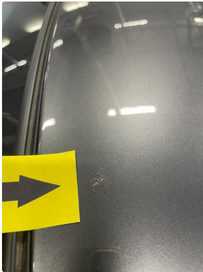
1.6 Steinsprut med rust