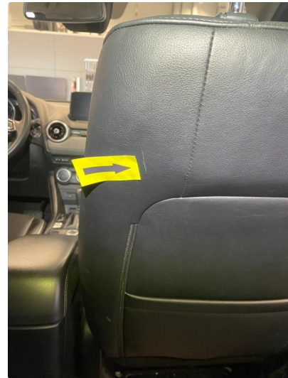
2.1 Skade på seterygg