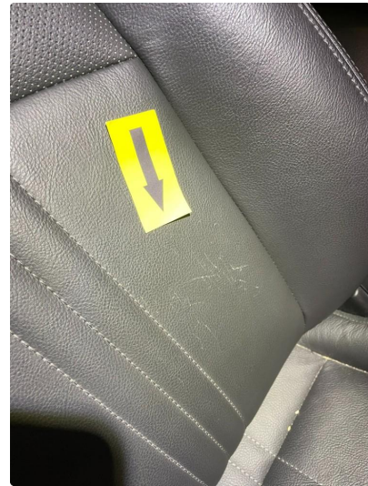
2.1 Skade på seterygg