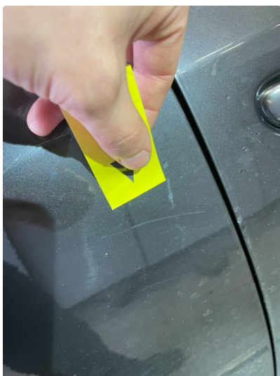
1.1 Generelt mye riper