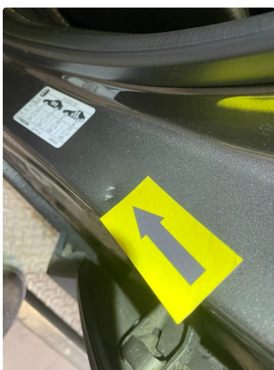
1.3 Bulk med lakkskade