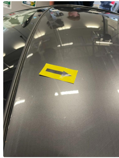
1.6 Steinsprut med rust