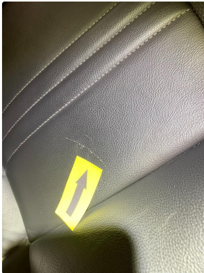
2.1 Skade på seterygg