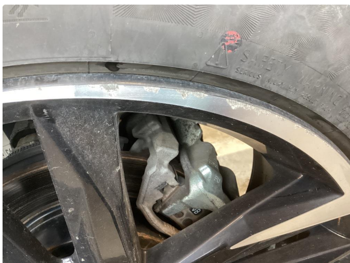
1.2 Skade på felg