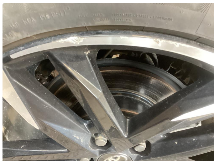
1.2 Skade på felg