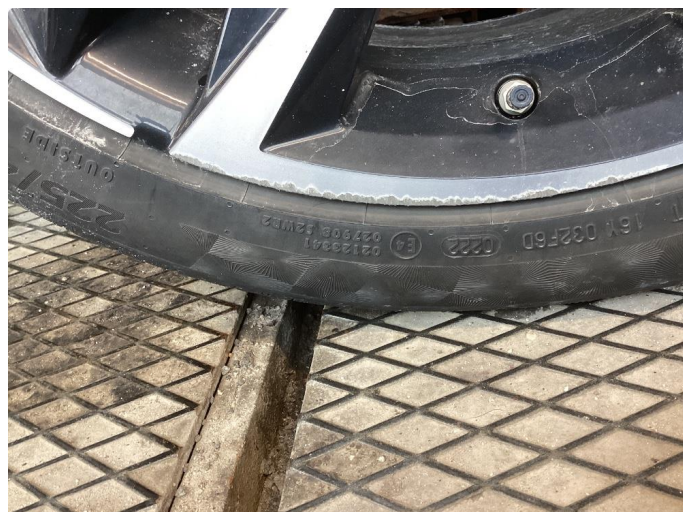
1.2 Skade på felg