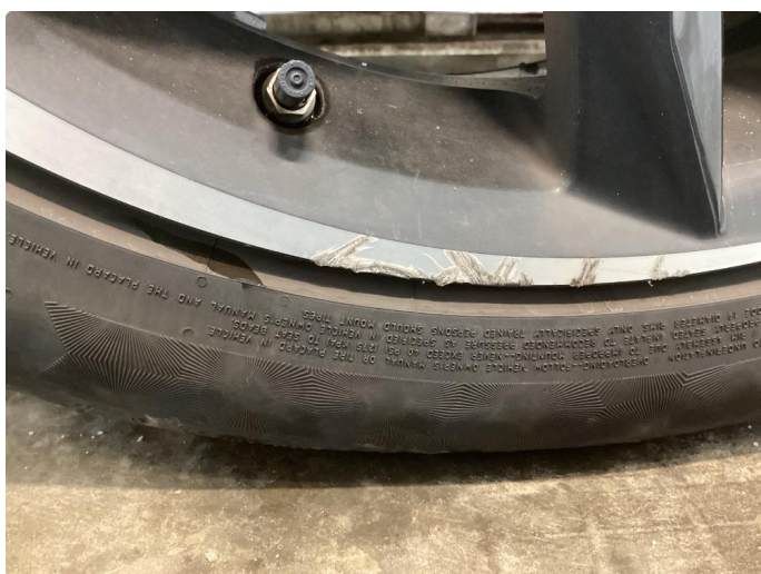
1.2 Skade på felg