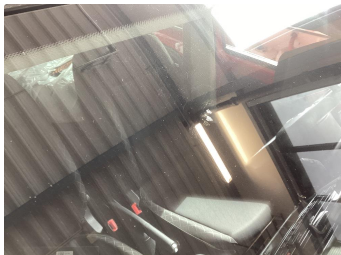
1.2 Frontruten har en del kraftige steinsprut