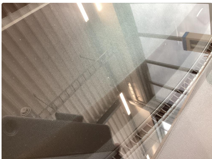
1.2 Frontruten har en del kraftige steinsprut