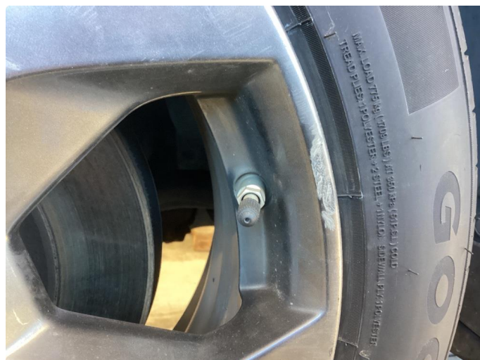
1.2 1 kantkjört sommerfelg