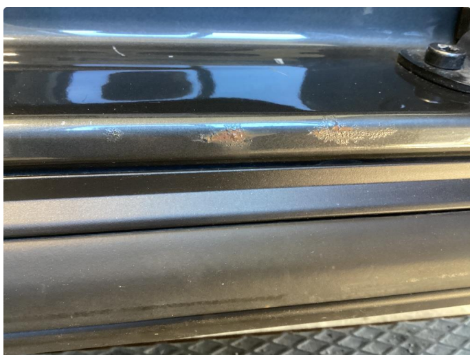
1.4 Rust i innsteg etter gnisseskade bakdører begge sider.