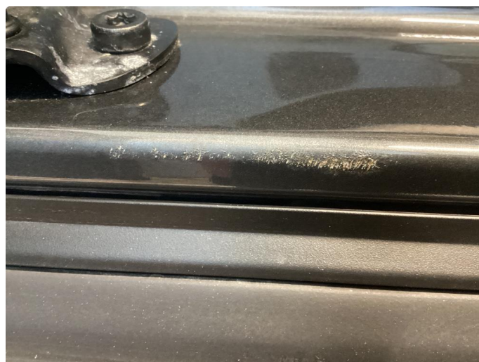
1.4 Rust i innsteg etter gnisseskade bakdører begge sider.