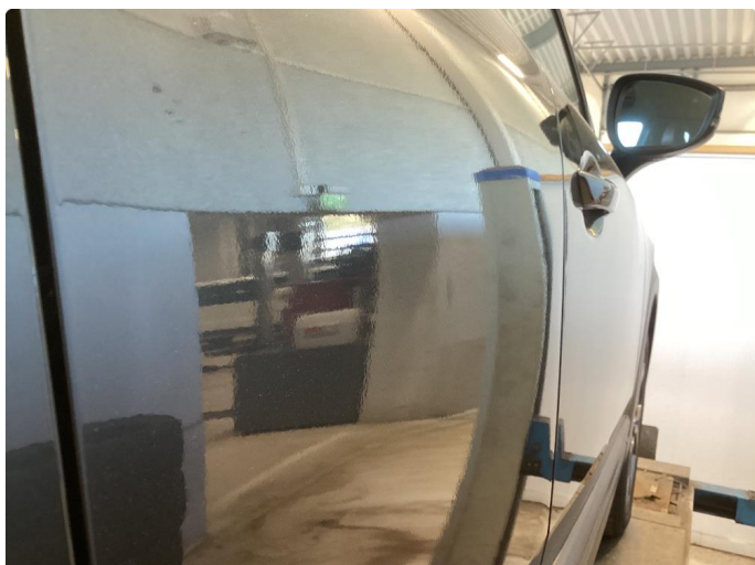
1.1 P-bulk høyre bakdør