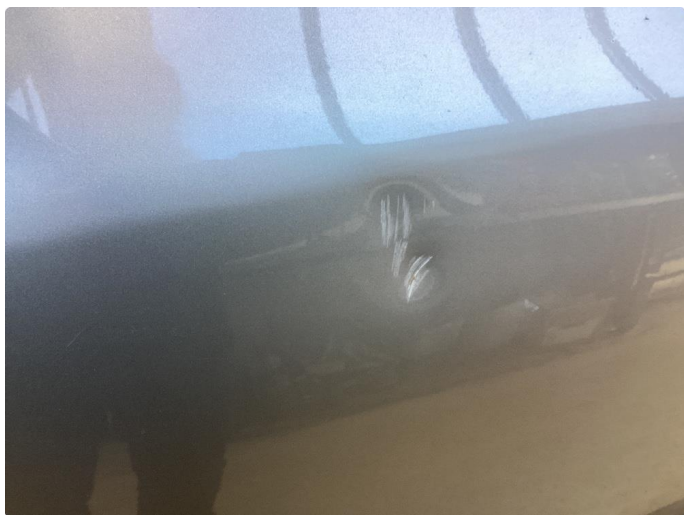
1.2 Skader venstre fordør