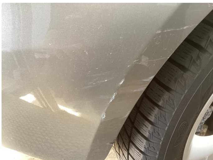
1.1 Mye små skader i karosseri