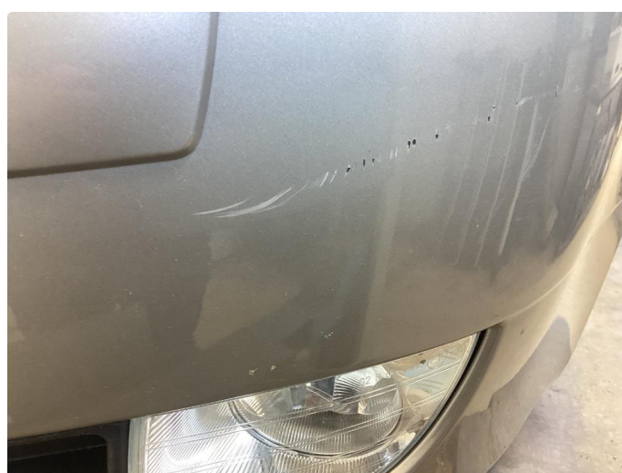
1.1 Mye små skader i karosseri