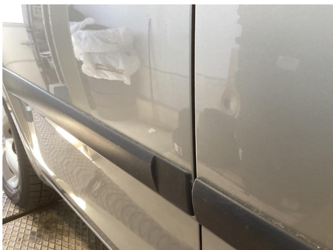
1.1 Mye små skader i karosseri