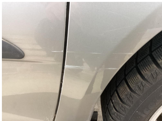
1.1 Mye små skader i karosseri