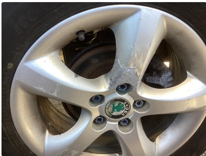
1.3 Oxyderte vinterfelger