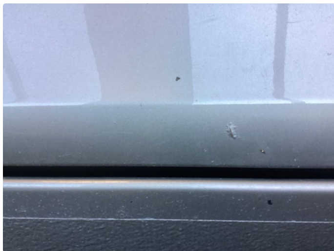
1.1 Mye små skader i karosseri