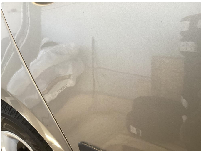
1.1 Mye små skader i karosseri