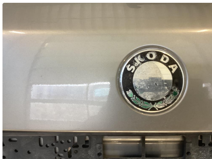
1.1 Mye små skader i karosseri