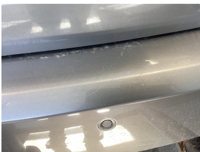
1.1 Mye små skader i karosseri