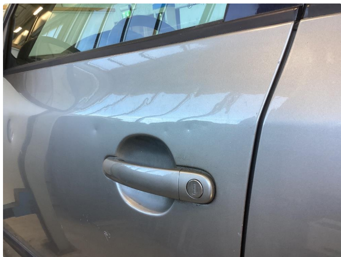
1.2 Skader venstre fordør