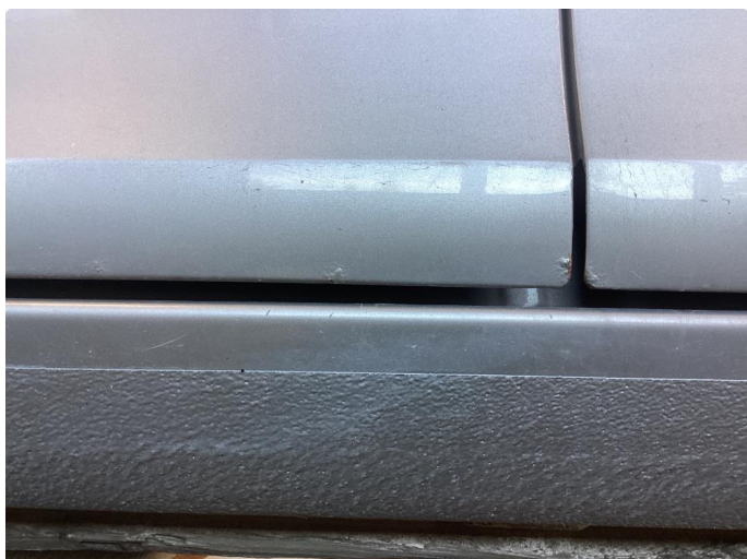
1.1 Mye små skader i karosseri