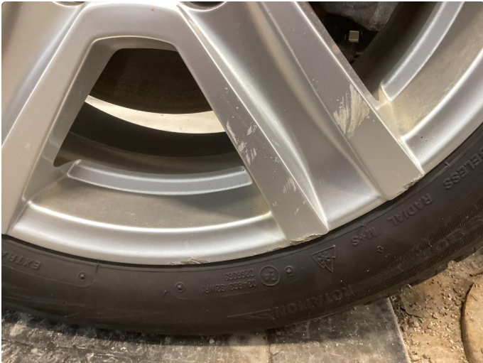
1.1 2 kantkjørte vinterfelger