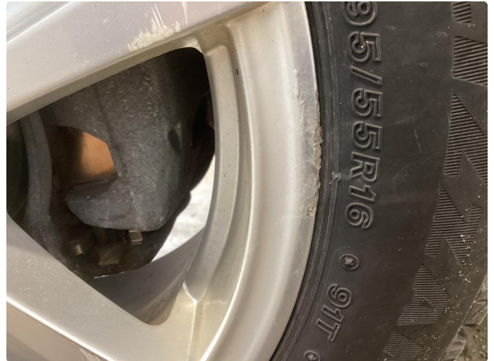
1.1 2 kantkjørte vinterfelger