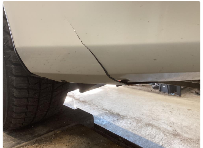
1.2 Sprekt støtfanger foran