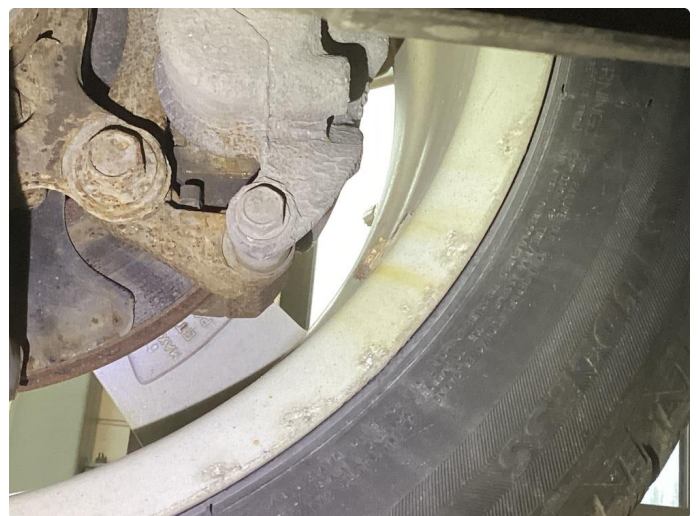
3.1 Rust bremer foran innside