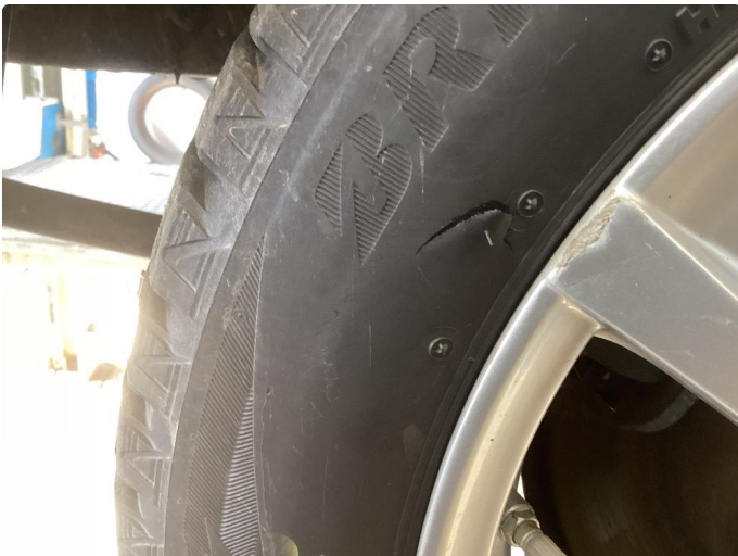
1.1 2 kantkjørte vinterfelger