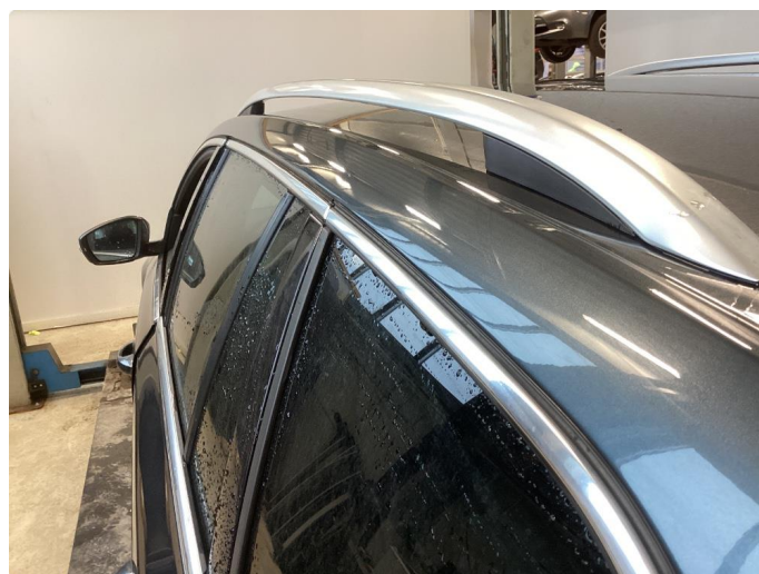
1.7 Bulk venstre takvange