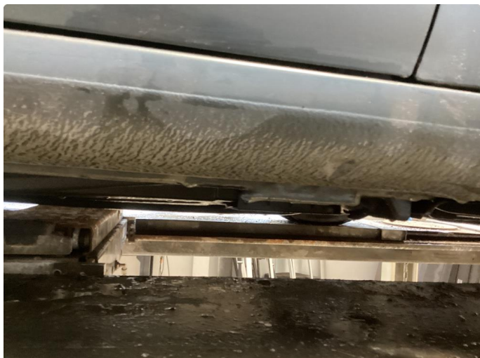
1.1 Slitt lakk på sidene