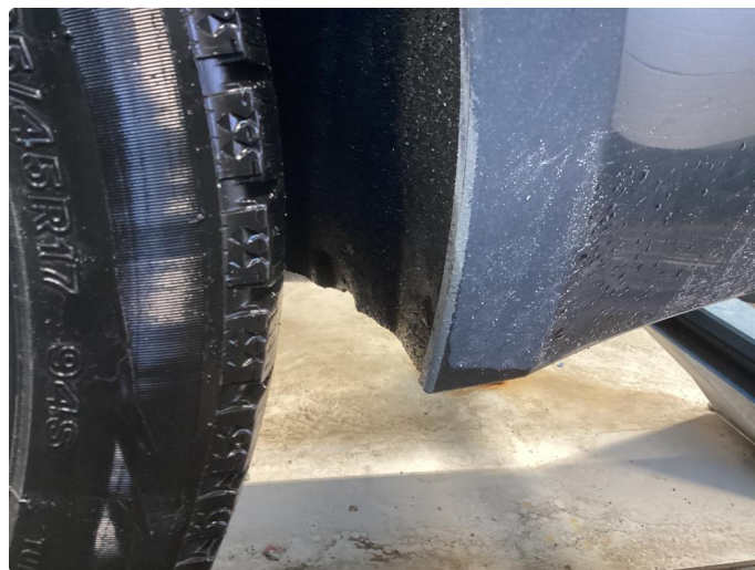
1.6 Div riper fanger bak