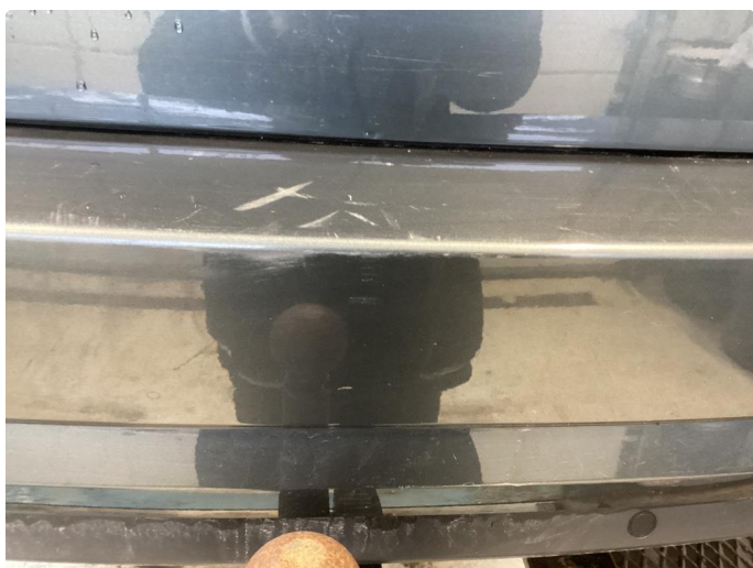
1.6 Div riper fanger bak