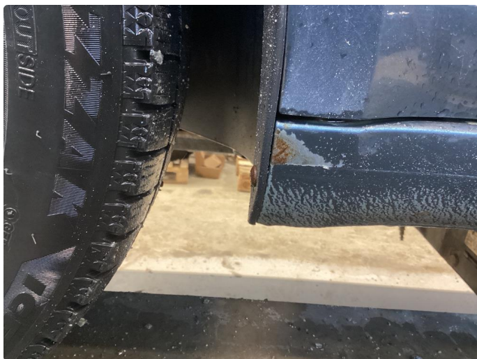
1.9 Lakk flasser fremkant begge sider