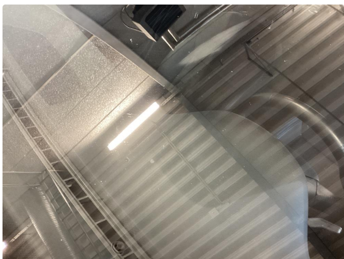
1.8 Noe slitt