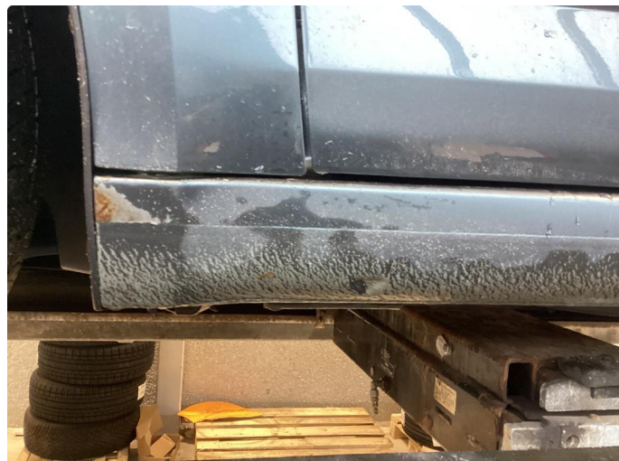
1.1 Slitt lakk på sidene