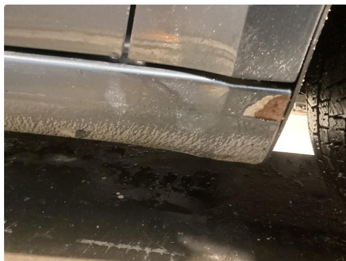
1.9 Lakk flasser fremkant begge sider