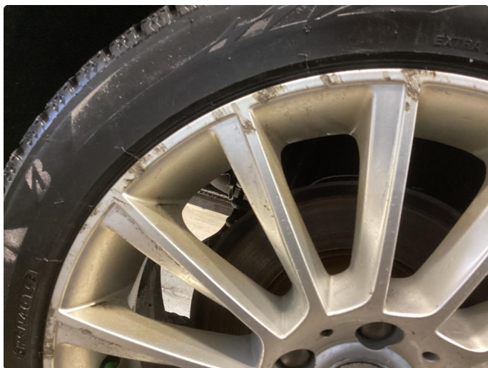
1.5 Kantkjørt felg