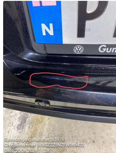
2.2 Rust og riper. noe flekket og noen bobler. venstre fordør, nede framme ripe midt på venstre bakdør, rust rundt håndtak venstre bakskjerm. mot fanger. er flekket bakluke, flekket bakfanger. riper rundt om høyre bakskjerm, rust er flekket høyre fordør, rust rundt dørhåndtak og nede framme