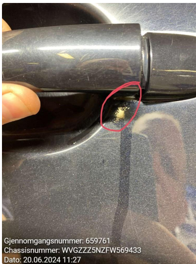
2.2 Rust og riper. noe flekket og noen bobler. venstre fordør, nede framme ripe midt på venstre bakdør, rust rundt håndtak venstre bakskjerm. mot fanger. er flekket bakluke, flekket bakfanger. riper rundt om høyre bakskjerm, rust er flekket høyre fordør, rust rundt dørhåndtak og nede framme