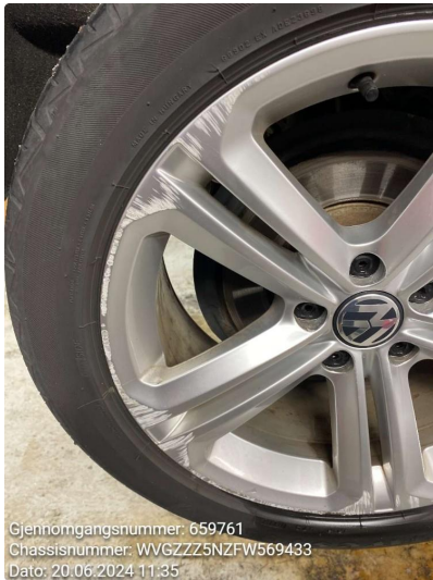
2.1 Kantkjørt felg