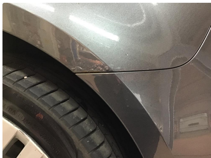
1.3 Rust begge bakskjermer mot støtfanger