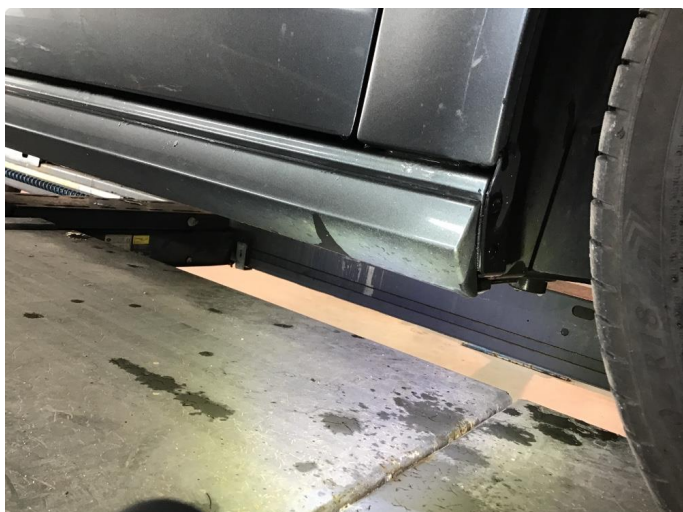
1.1 Matt lakk kanalskjørter/støtfanger bak