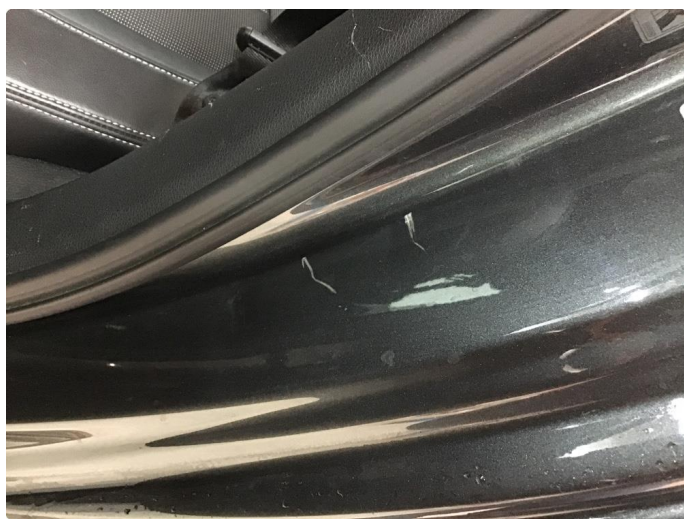
1.5 Riper innsteg venstre bakdør