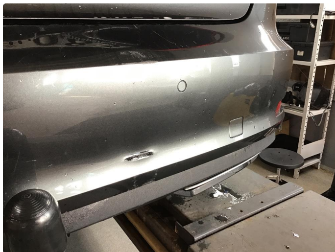
1.6 Flere bulker og riper støtfanger bak. En p sensor litt løs