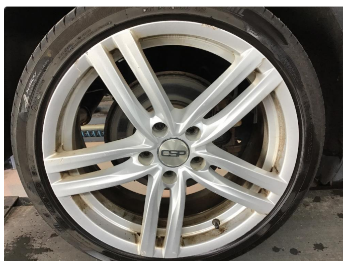
1.4 Sommerfelger noe kantkjørte