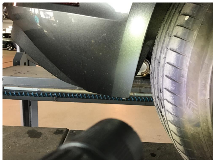
1.1 Matt lakk kanalskjørter/støtfanger bak