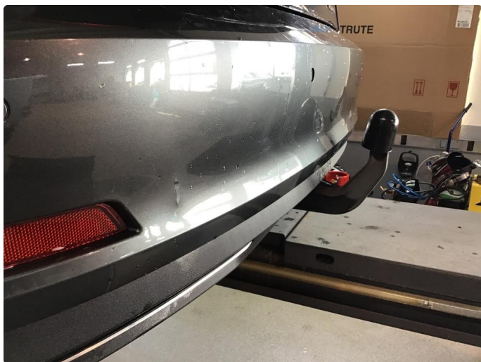
1.6 Flere bulker og riper støtfanger bak. En p sensor litt løs