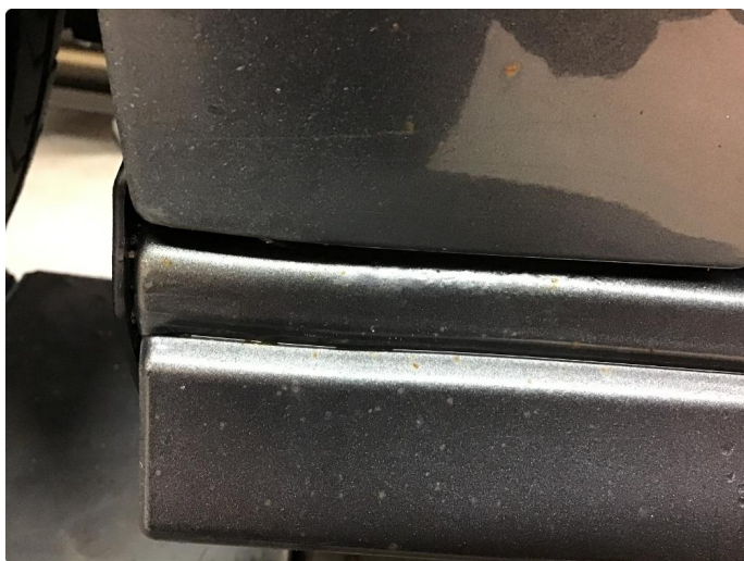
1.8 Rustbobler begge kanaler underkant av forskjermer.