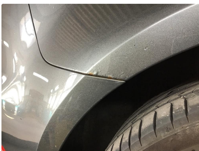
1.3 Rust begge bakskjermer mot støtfanger