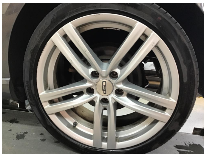
1.4 Sommerfelger noe kantkjørte