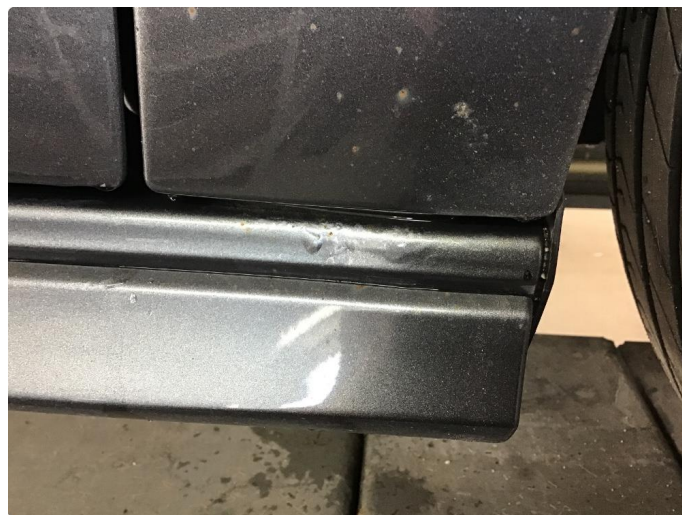
1.8 Rustbobler begge kanaler underkant av forskjermer.