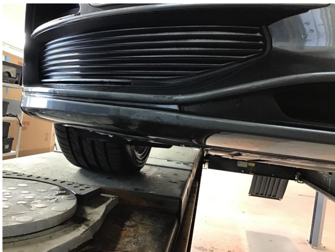
1.7 Riper spoiler støtfanger foran