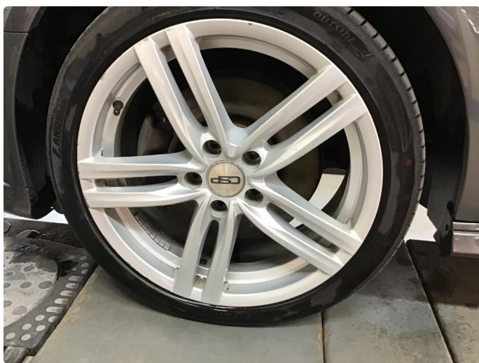
1.4 Sommerfelger noe kantkjørte