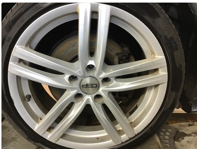
1.4 Sommerfelger noe kantkjørte